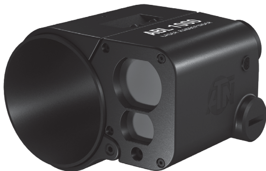
POMOCNÝ BALISTICKÝ LASER (ABL 1000/1500)

Důležitá omezení pro vývoz! Zboží, výrobky, technologie a služby obsažené v této příručce podléhají jednomu nebo více zákonům a předpisům pro kontrolu exportu Úřadu pro průmysl a bezpečnost Ministerstva obchodu USA, předpisy správního úřadu pro vývoz. Je nezákonné a přísně zakázané vyvážet nebo pokoušet se vyvážet nebo jinak převádět nebo prodávat jakékoli hardwarové nebo technické údaje nebo poskytovat jakoukoli službu jakékoli zahraniční osobě, ať už v zahraničí nebo v USA, pro kterou je vyžadováno povolení nebo písemný souhlas vlády USA, aniž by nejprve získala požadované povolení nebo písemný souhlas ministerstva vlády USA, které k tomu má pravomoc. Odchylení v rozporu se zákony USA je zakázáno.